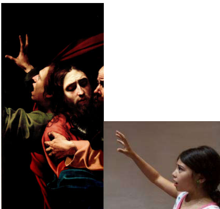
Figura 2 – Caravaggio, Cattura di Cristo , 1602, Dublino, National Gallery of Ireland, particolare