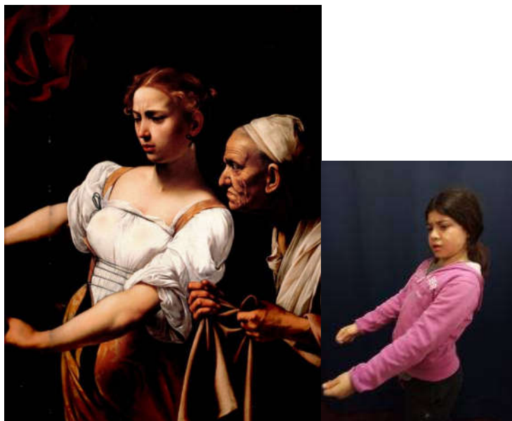
Figura 1 – Caravaggio, Giuditta che taglia la testa a Oloferne , 1598/1599, Galleria nazionale d'arte antica, Palazzo Barberini, Roma, particolare