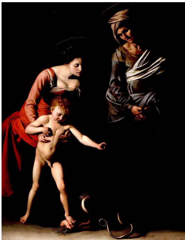
Figura 5 – Caravaggio, Madonna dei Palafrenieri , 1605, Galleria Borghese, Roma