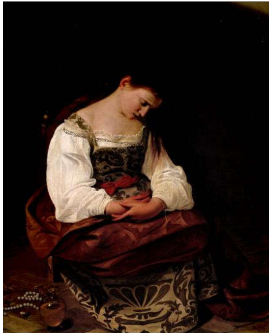
Figura 4 – Caravaggio, Maddalena penitente , 1595-1596, Galleria Doria Pamphili, Roma